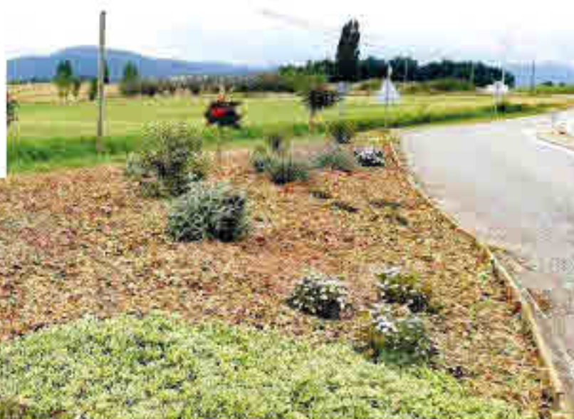
Plantations et accessoires