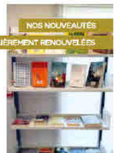
NOS NOUVEAUTÉS RÉGULIÈREMENT RENOUVELÉES