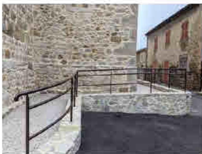
Entreprises UNION Philippe de Félines