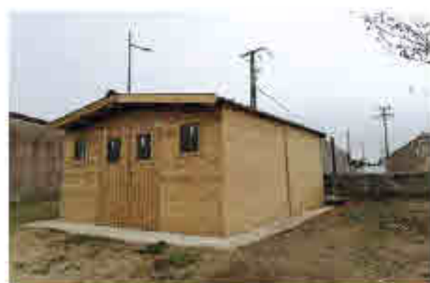
à stockage de matériaux