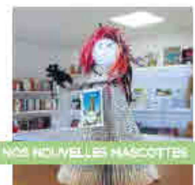
NOS NOUVELLES MASCOTTES