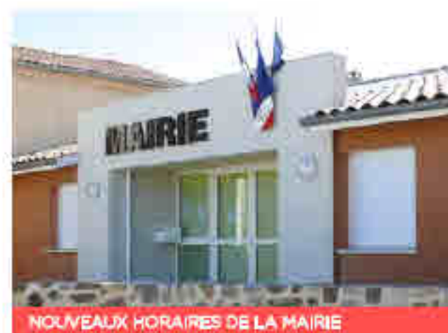
NOUVEAUX HORAIRES DE LA MAIRIE

À compter du 5 janvier 2022, le secrétariat de Mairie sera ouvert le lundi de 16h à 18h30, le jeudi de 16h à 18h30 et le vendredi de 10h à 12h et de 15h à 17h. Cependant, le Maire reste disponible le samedi matin, uniquement sur RDV.